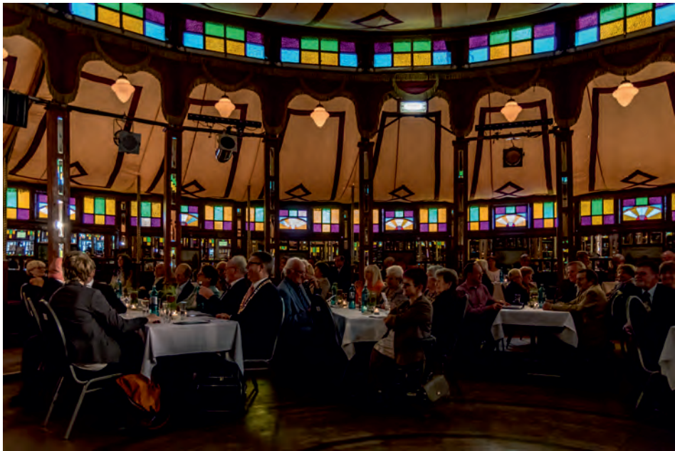
Jurate Minde und Armin Rau moderierten die Schlagerrevue

Die Veranstaltung fand im „Tipi am Schlossberg“ statt