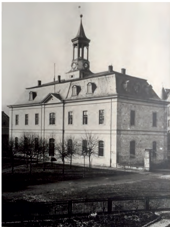
Altes Dillenburger Archiv