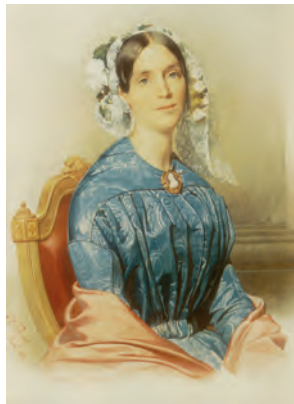
Marianne der Niederlande

Wie weiter oben schon berichtet, wäre durch die finanzielle Unterstützung von Prinzessin Marianne der Niederlande (1810-1883), einer Tochter des niederländischen Königs Wilhelm I., der Wilhelmsturm wohl niemals in seiner heutigen Form erbaut worden. Zudem zeichnete sich die Prinzessin, die ihren Wohnsitz im Schloss Reinhartshausen in Erbach hatte, durch ein außergewöhnliches soziales Engagement aus. In Dillenburg unterstützte sie nicht nur wohltätige Vereine, sondern auch karitative Projekte. Auch für die Stadtarmen spendete Marianne stets ansehnliche Beträge. So erwarb sie sich große Sympathien bei der Dillenburger Bevölkerung.